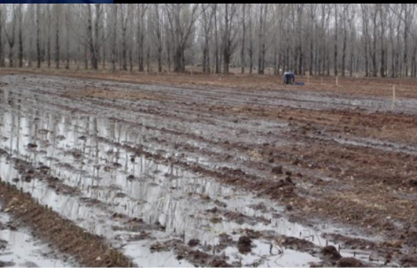
Nursery irrigation ( Populus sp. )