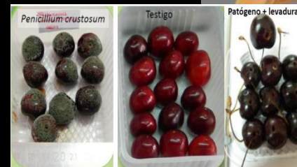
Effectivity of native yeast from Patagonia over the growth of cherry postharvest patogen .